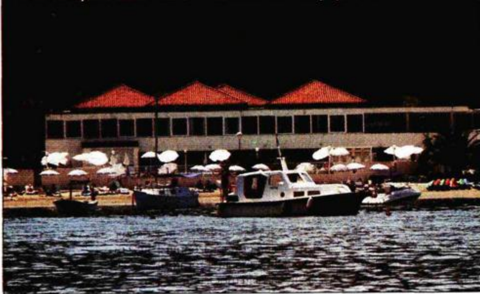
Polovica zaposlenika svim se silama bori za svoja prava